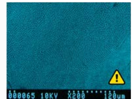
60 minuutin ajan 40% vetyperoksidilla käsitellyn kiilteen rakenne vastaa etsattua kiillettä