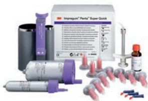
3M™ Impregum™ Penta™ Super Quick peruspakkaus (69383)

P31684 3M™ Impregum™ Penta™ 1 kpl base à 300ml, 1 kpl katalyytti à 60ml, 1 kpl 3M™ Impregum™ Penta™ kasetti, 10 kpl Penta™ sekoituskärkeä (punainen), 1 kpl Penta™ elastomeeriruisku, 1 pullo polyeetteriliimaa à 17ml