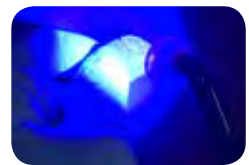
Valokovetus suun ulkopuolella

TEMPSMART DC on valokovetteinen ja tarjoaa siksi mahtavia etuja: voit itse hallita kovetusajaa ja optimoida lopullista polymerisaatiota. Näin toimenpiteestä tulee helpompi ja tehokkaampi, ja säästät runsaasti aikaa . Valokovetus parantaa myös väliaikaisen työn fysikaalisia ominaisuuksia, erityisesti sen taivutuslujuutta.